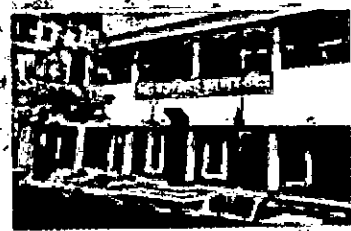
সিটি কলেজিয়েট স্কুল