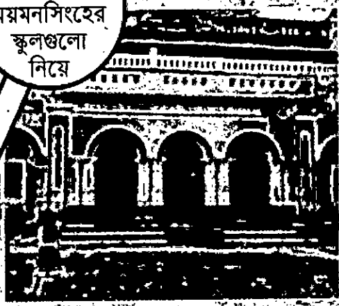
ময়মনসিংহে মেয়েদের নামকরা স্কুল রাধা সুন্দরী