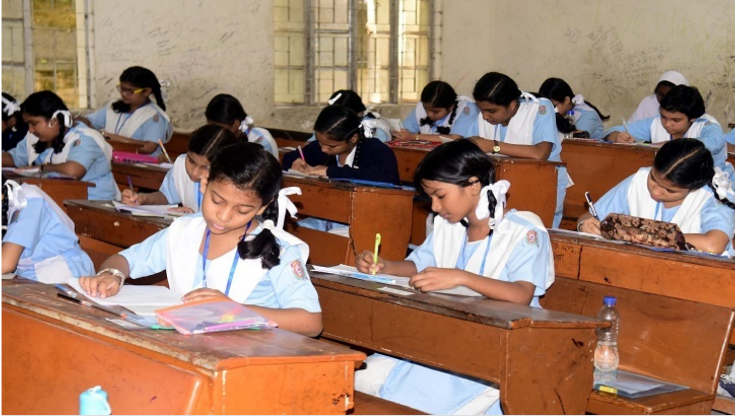
প্রাথমিক সমাপনী পরীক্ষায় শিক্ষার্থীরা।

দেশের সবচেয়ে বড় পরীক্ষা প্রাথমিক ও ইবতেদায়ি শিক্ষা সমাপনী পরীক্ষা রোববার শুরু হয়েছে। ক্ষুদে শিক্ষার্থীদের এই পরীক্ষায়ও একজন বহিষ্কৃত হয়েছে। সে মাদ্রাসার ইবতেদায়ি স্তরের শিক্ষার্থী। প্রথম দিন প্রাথমিক ও ইবতেদায়িতে উভয় স্তরে ইংরেজি বিষয়ের পরীক্ষা ছিল। আজ বাংলা পরীক্ষা নেয়া হবে।