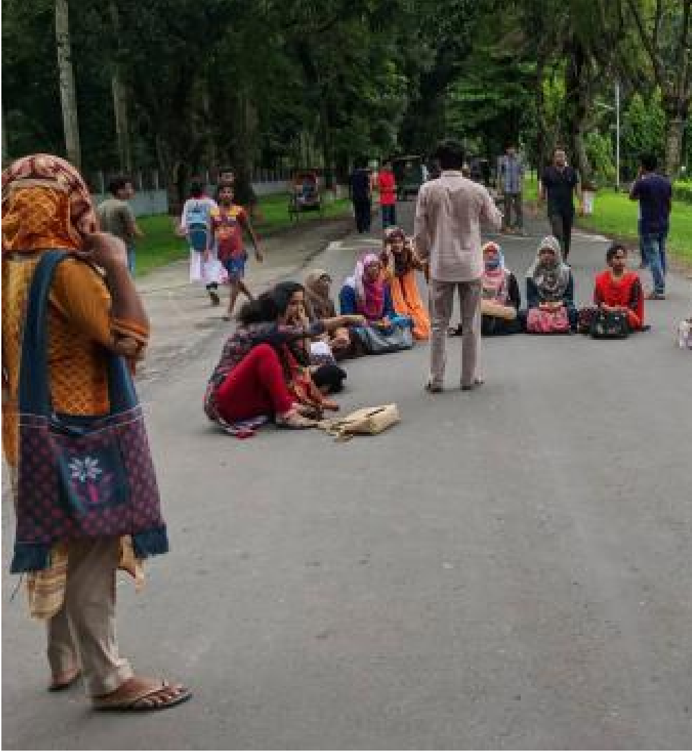
ক্যাম্পাসে নিরাপত্তার দাবিতে সড়ক অবরোধ করেন বাংলাদেশ কৃষি বিশ্ববিদ্যালয়ের শিক্ষার্থীরা।

ক্যাম্পাসে নিরাপত্তার দাবিতে সড়ক অবরোধ করেছেন বাংলাদেশ কৃষি বিশ্ববিদ্যালয়ের শিক্ষার্থীরা। আজ শনিবার সকালে উপাচার্যের বাসভবনের সামনে সড়ক অবরোধ করেন শিক্ষার্থীরা। এ সময় ক্যাম্পাসে নিরাপত্তা নিশ্চিত করতে বেশ কিছু দাবি জানান শিক্ষার্থীরা।