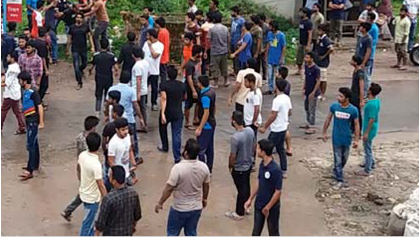
রাবি ছাত্রলীগের দু'গ্রুপের মধ্যে সংঘর্ষ

আবাসিক হলের গেস্ট রুমে বসা নিয়ে রাজশাহী বিশ্ববিদ্যালয় (রাবি) শাখা ছাত্রলীগের দুই গ্রুপের মধ্যে দুই দফায় সংঘর্ষের ঘটনা ঘটেছে।