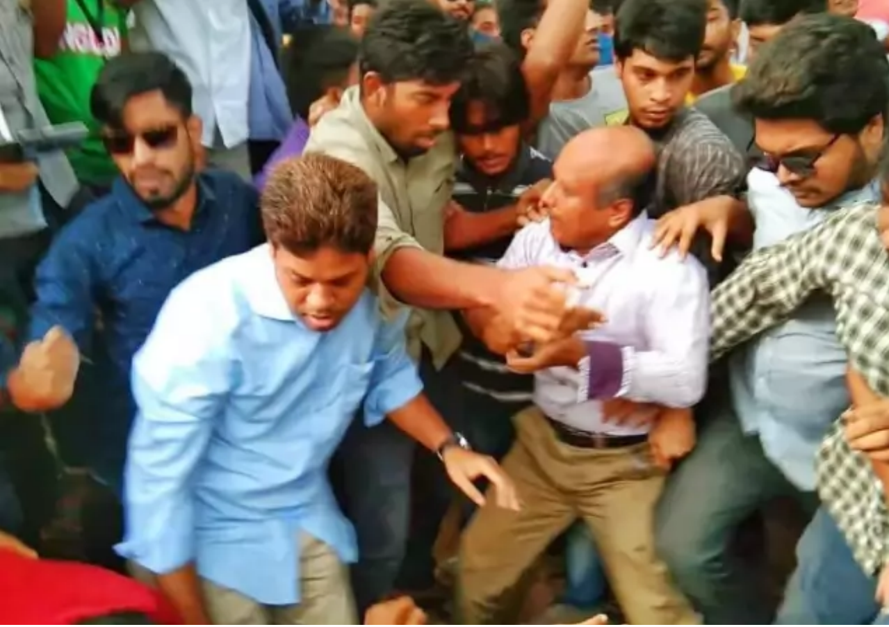
জাহাঙ্গীরনগর বিশ্ববিদ্যালয়ের উপাচার্যের পদত্যাগের দাবিতে আন্দোলনরত শিক্ষক-শিক্ষার্থীদের ওপর হামলা হয়।

প্রত্যক্ষদর্শী ব্যক্তির বলছেন, এর কিছুক্ষণ পর জাহাঙ্গীরনগর বিশ্ববিদ্যালয় ছাত্রলীগের ব্যানারবাহী একটি মিছিল সেখানে আসে। ওই মিছিলে দুই শতাধিক নেতা-কর্মী ছিলেন। মিছিল থেকে উপাচার্যবিরোধী আন্দোলনকারীদের ওপর হামলা হয়। মিছিলকারীরা উপাচার্যবিরোধী আন্দোলনকারী শিক্ষার্থী-শিক্ষকদের সেখান থেকে হটিয়ে দেন। তারপর তাঁরা ওই জায়গায় অবস্থান নেয়। বেলা একটায় এ প্রতিবেদন লেখা পর্যন্ত ছাত্রলীগের নেতা-কর্মীরা উপাচার্যের বাসভবনের সামনে অবস্থান নিয়েছিলেন।