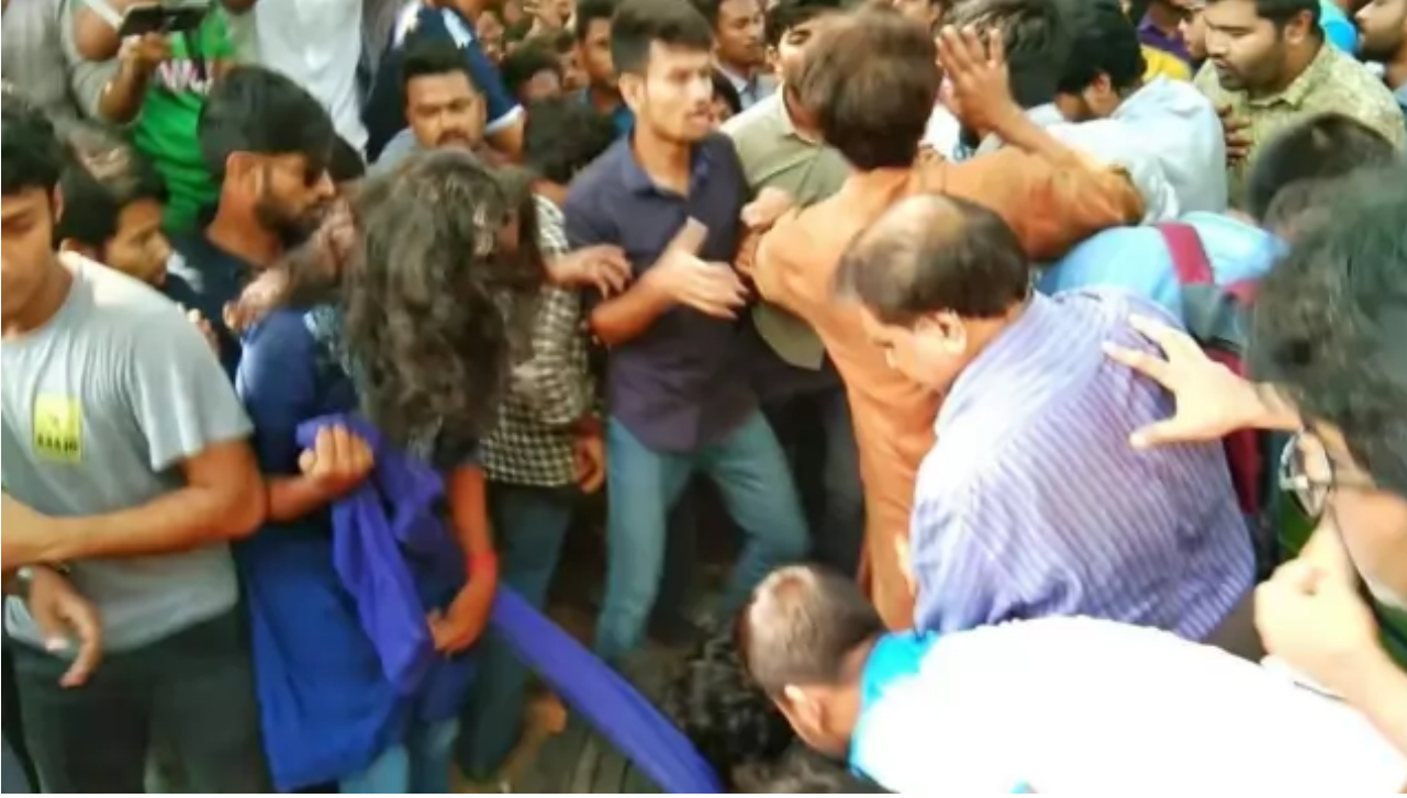
জাহাঙ্গীরনগর বিশ্ববিদ্যালয়ের উপাচার্যের বাসভবনের সামনে সংঘর্ষ।

আজকের হামলার ঘটনায় এ পর্যন্ত বিশ্ববিদ্যালয়ের চিকিৎসাকেন্দ্রে ১২ জন চিকিৎসা নিয়েছেন। অন্তত ২০ জনকে এনাম মেডিকেল কলেজ হাসপাতালে পাঠানো হয়েছে।