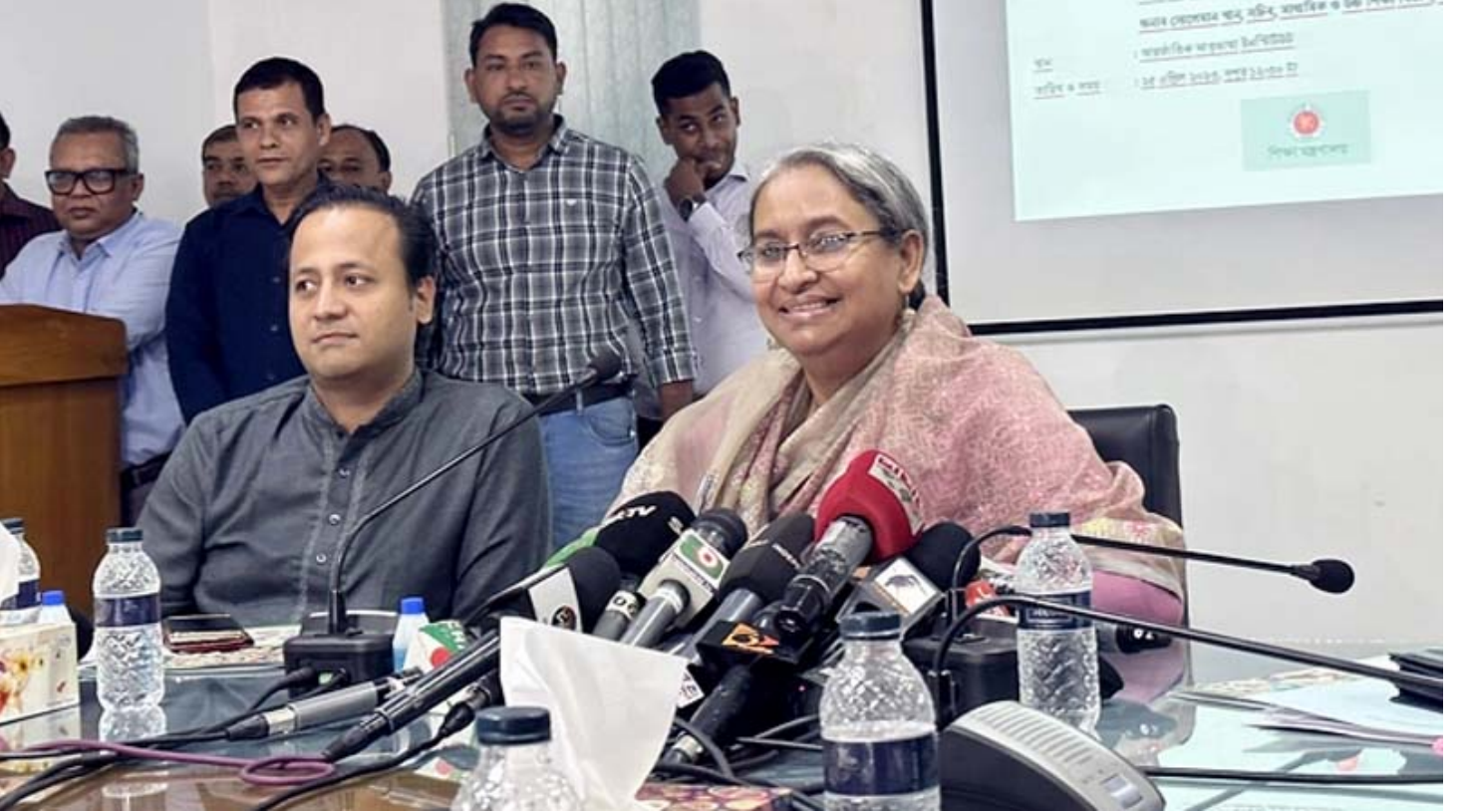
শিক্ষামন্ত্রী দীপু মনি।

এসএসসি ও সমমানের পরীক্ষার জন্য আগামী ২৬ এপ্রিল থেকে ২৩ মে পর্যন্ত দেশের সব কোচিং সেন্টার বন্ধ থাকবে বলে জানিয়েছেন শিক্ষামন্ত্রী দীপু মনি।