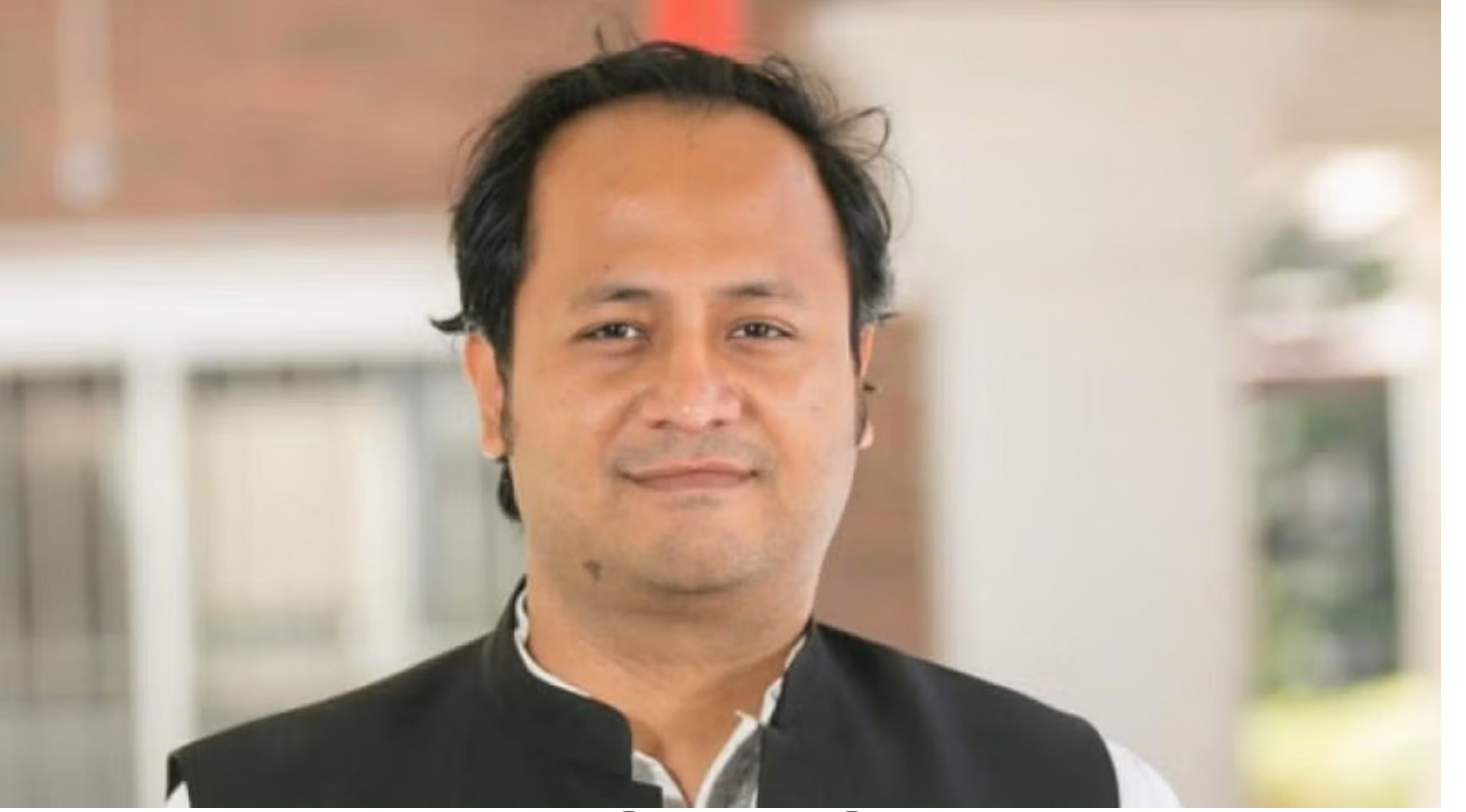
নতুন শিক্ষামন্ত্রী মহিবুল হাসান চৌধুরী নওফেল

প্রকাশিত: ২০:৪৩, ১৩ জানুয়ারি ২০২৪; আপডেট: ২০:৪৫, ১৩ জানুয়ারি ২০২৪