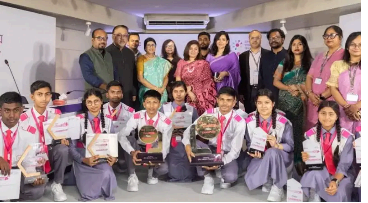
ব্র্যাক মাধ্যমিক বিদ্যালয় বিতর্ক উৎসব