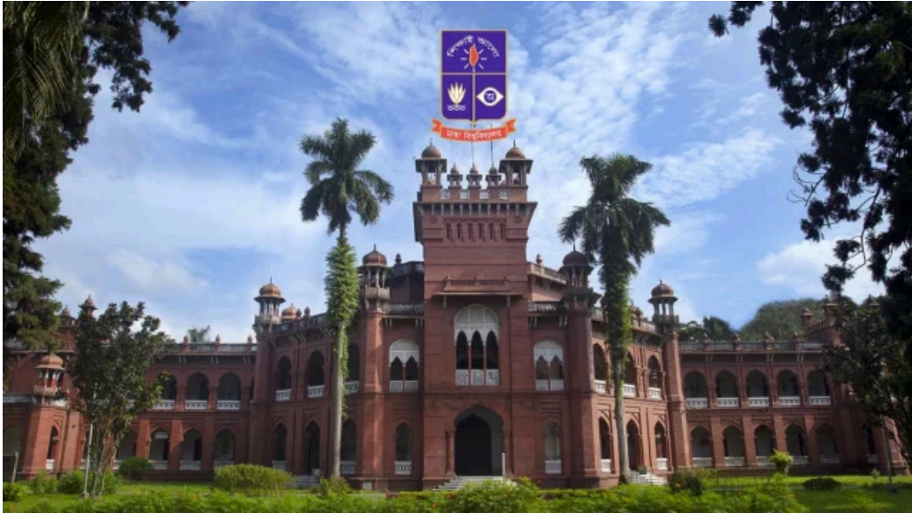
ঢাকা বিশ্ববিদ্যালয় (ঢাবি)

মঙ্গলবার (২২ এপ্রিল) ঢাকা বিশ্ববিদ্যালয়ের জনসংযোগ দপ্তর থেকে পাঠানো এক সংবাদ বিজ্ঞপ্তিতে আরো বলা হয়, আগামী আগস্ট মাসে চীনের শিক্ষার্থীরা দুই সেমিস্টারের জন্য ঢাকা বিশ্ববিদ্যালয়ে পড়তে আসার আগ্রহ দেখিয়েছেন। একই সঙ্গে প্রফেশনাল মাস্টার্স কোর্সে পড়ারও আগ্রহ দেখিয়েছেন তারা। এলক্ষ্যে চীনের আরো কয়েকটি বিশ্ববিদ্যালয় ঢাকা বিশ্ববিদ্যালয়ের সঙ্গে সমঝোতা স্মারক সই করতে চায়। সেজন্য উভয়পক্ষের মধ্যে আলোচনাও হয়েছে। খুব শিগগিরই বেশ কয়েকটি সমঝোতা স্মারক সই হতে পারে।