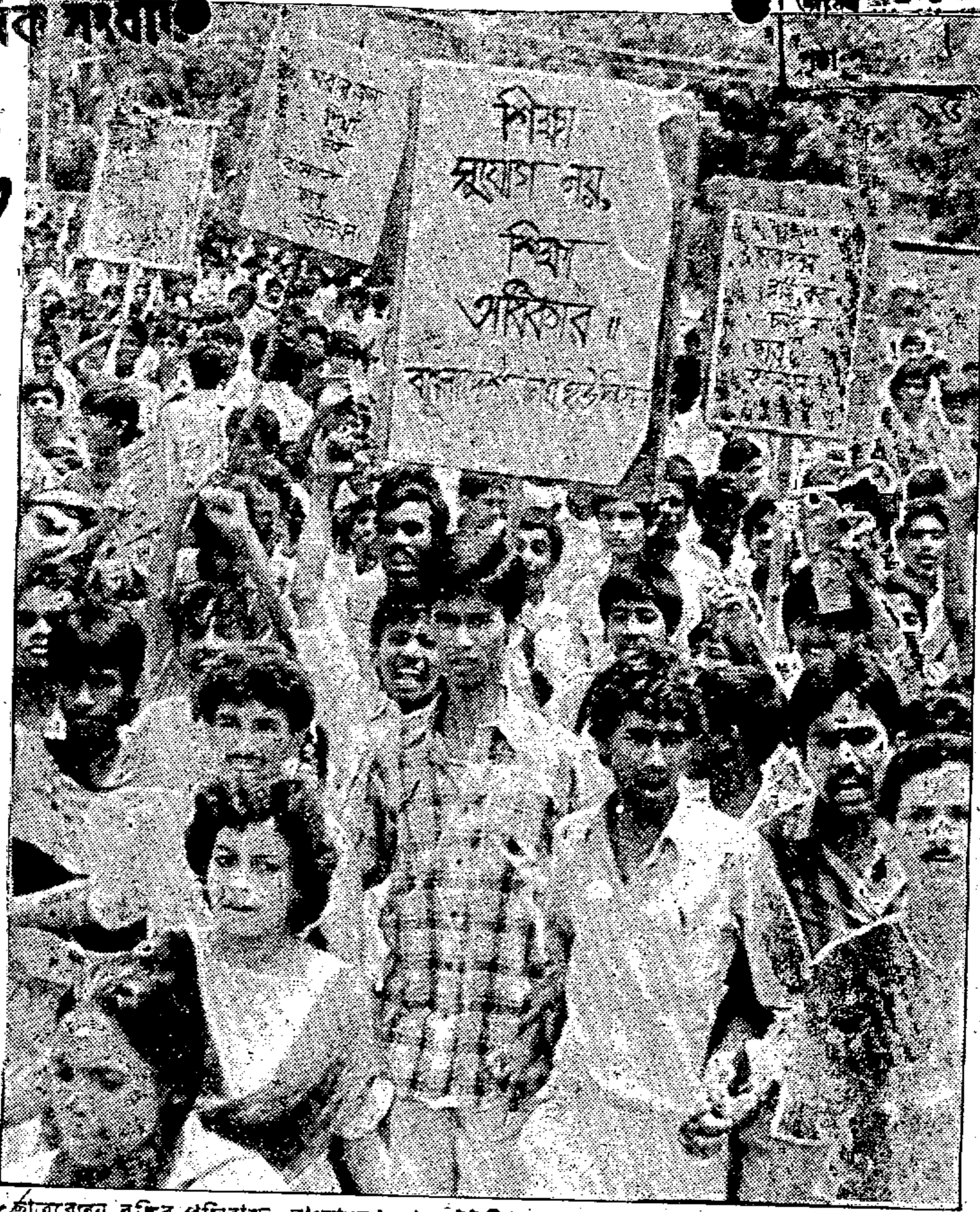
ছাত্রবেতন বৃদ্ধির প্রতিবাদে বাংলাদেশ ছাত্র ইউনিয়ন মহানগরী শাখা গতকাল সোমবার শহীদ মিনারে সমাবেশে এক মিছিল ধের করে।

কেন্দ্রীয় শহীদ মিনারে ছাত্র সমাবেশ ॥ শিক্ষা মহাপরিচালকের কাছে স্মারকলিপি পেশ