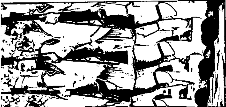
পানে রাজধানী এথেন্সের শ্রেণিভেদে গ্রাসাদে এক গ্রীক শ্রেণিভেদে ক্যারোলস গাপুলিয়াসকে গার্ড -এপ্রফি