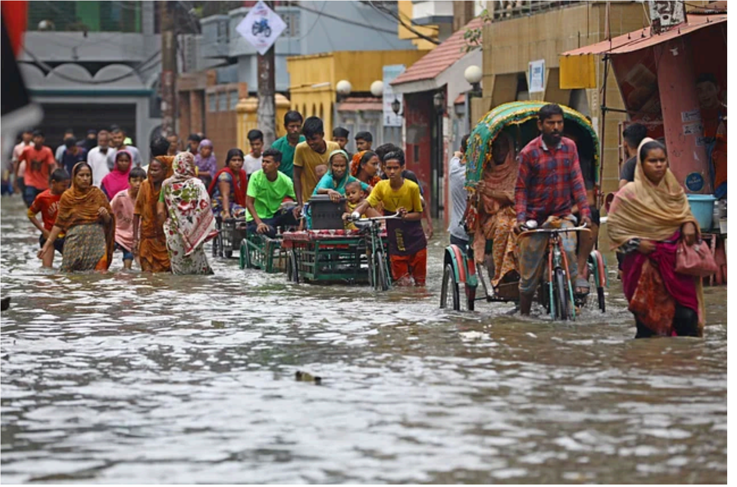
অতি বৃষ্টি ও উজান থেকে আসা ঢলে তলায় সিলেট নগরের তেরোরতন এলাকা। গত সোমবার সকালে

দেশের কোনো অঞ্চলে বন্যা পরিস্থিতি ব্যাপকভাবে ছড়িয়ে পড়লে ওই অঞ্চলের এইচএসসি ও সমমানের পরীক্ষা পরে নেওয়া হবে বলে জানিয়েছেন শিক্ষামন্ত্রী মহিবুল হাসান চৌধুরী। তবে এখন পর্যন্ত তাঁদের আশা ৩০ জুন থেকেই পরীক্ষা নেওয়া সম্ভব হবে।