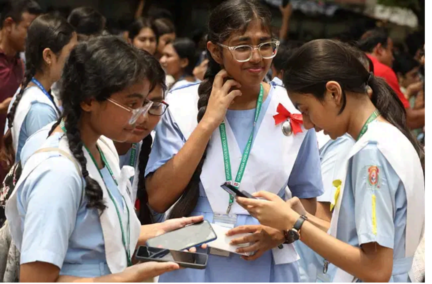
মাধ্যমিক স্কুল সার্টিফিকেট ও সমমান পরীক্ষার ফলাফল মুঠোফোনে দেখছে শিক্ষার্থীরা। ফাইল ছবি

একাদশ শ্রেণিতে ভর্তি আবেদনে লিঙ্গ ও পেমেন্ট জটিলতা সমাধানে করণীয় কী, তা জানিয়ে নির্দেশনা দেওয়া হয়েছে এ- সংক্রান্ত ভর্তির ওয়েবসাইটে । আবেদন বাতিল বা মুঠোফোন নম্বর পরিবর্তনের জন্য নির্দেশনাও দেওয়া হয়েছে।