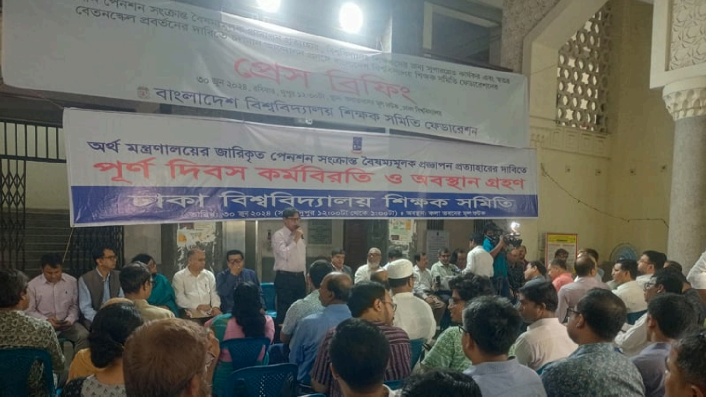
ঢাকা বিশ্ববিদ্যালয়ের কলাভবনের মূল ফটকে বাংলাদেশ বিশ্ববিদ্যালয় শিক্ষক সমিতি ফেডারেশনের সংবাদ সম্মেলন।

সর্বজনীন পেনশনের 'প্রত্যয়' স্কিমের প্রজ্ঞাপন প্রত্যাহার দাবি